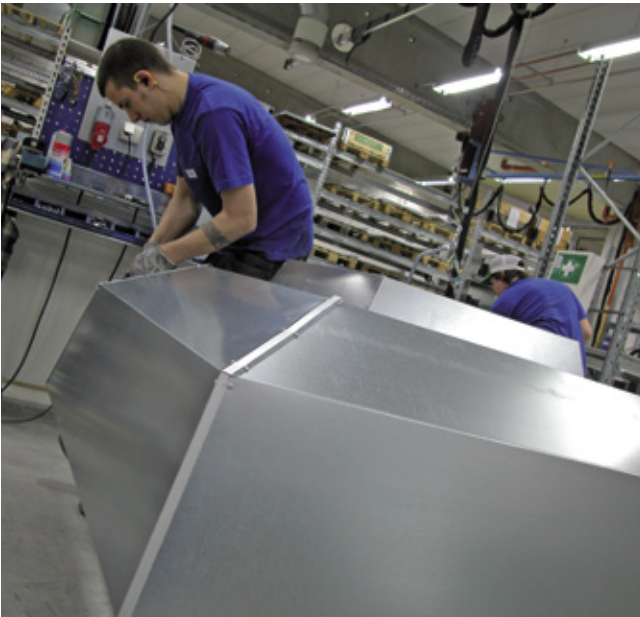
Montering av avluftshuv BRFH i fabriken i Motala.

Vår utvecklingsavdelning har tillgång till eget laboratorium för att testa och mäta våra produkter, där gör vi bland annat flödes- och tryckfallsmätningar. Vi testar även produkter på externa testinstitut såsom RISE - Research Institutes of Sweden och VTT i Finland. En ny möjlighet som vi också utnyttjar är datasimuleringar, så kallade cfd beräkningar, som förenklar utveckling och framtagning av nya produkter.