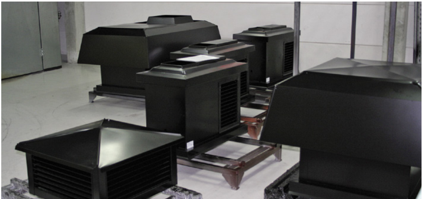
Takhuvar som nyligen pulverlackerats i korrosivitetsklass C4 och härdats i vår värmeugn.